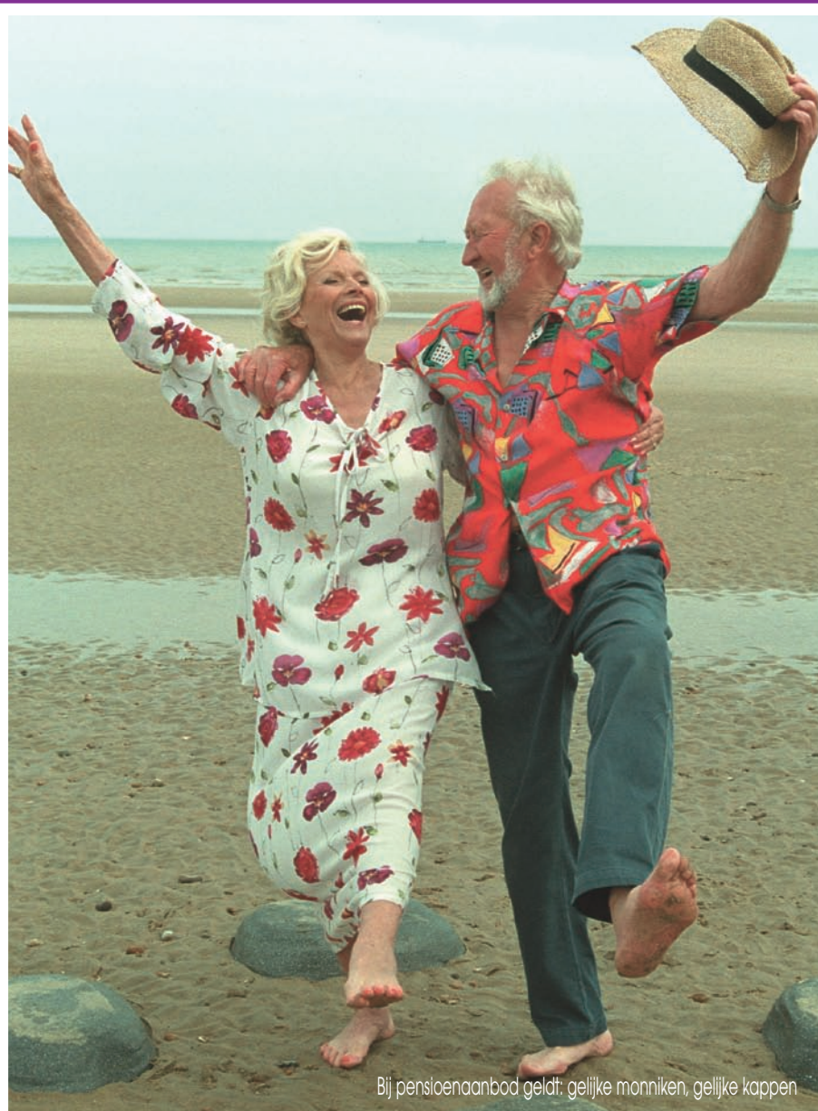
Bij pensioenaanbod geldt: gelijke monniken, gelijke kappen

De werkgever dient de werknemer kosteloos te voorzien van een duidelijke schriftelijke opgave (op papier) waarin staat welke pensioenaanspraken kunnen worden behaald op grond van de pensioen-